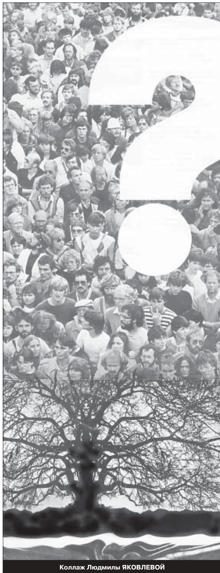
Коллаж Людмилы ЯКОВЛЕВОЙ