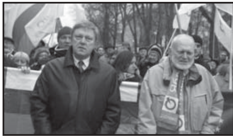
Григорий Явлинский и Алексей Яблоков на Марше мира. 15 марта. Москва. Пушкинская площадь.